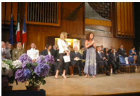
Sul palco del Conservatorio S. Pietro a Majella per ricevere il premio targa d'argento del Presidente della Repubblica