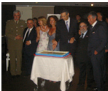
Al taglio della torta alla serata di gala dopo il premio.