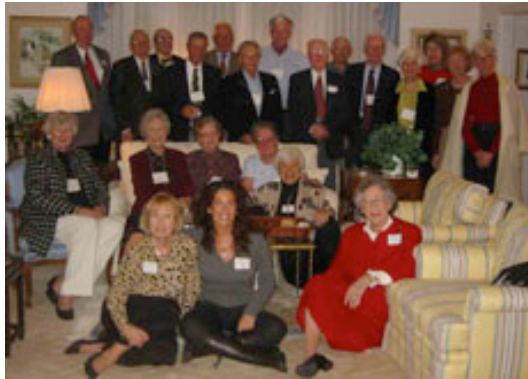
Con tutti i membri del board della Brunswick Community Concerts Association