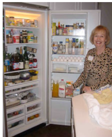
il frigorifero dopo il party... Immaginate com'era prima!!!